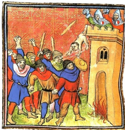
Les Pastoureaux tentent d'incendier la tour de Verdun sur Garonne où 500 juifs avaient trouvé refuge.

Cette intervention de Jordi Passerat a permis au public, nombreux et captivé, d'avoir une meilleure compréhension de cette période sombre de l'histoire médiévale de l'Occitanie pourtant réputée pour sa tolérance.